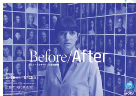
シリン・ネシャット (Land of Dreams) 2019 ©Shirin Neshat Courtesy of the artist and Gladstone Gallery