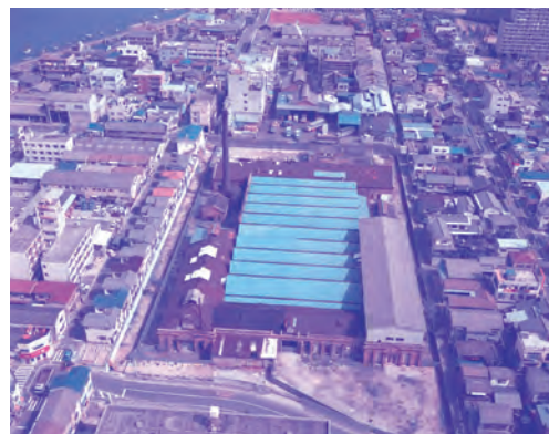
郷土資料館を南から(1985年)。この写真にある「実は」とは

広島市南区宇品御幸二丁目6-20 TEL(082)253-6771 FAX(082)253-6772 ホームページ http://www.cf.city.hiroshima.jp/kyodo/