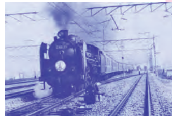
植物の「桜」と特急「さくら」