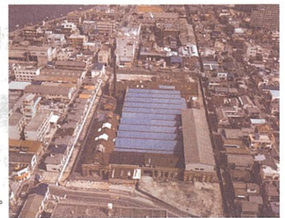
郷土資料館を南から(1985年)。この写真にある「実は」とは

広島市南区宇品御幸二丁目6-20 TEL(082)253-6771 FAX(082)253-6772 ホームページ http://www.cf.city.hiroshima.jp/kyodo/