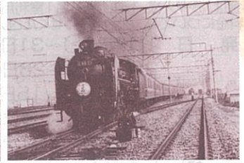
植物の「桜」と特急「さくら」