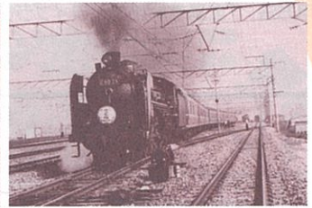
植物の「桜」と特急「さくら」