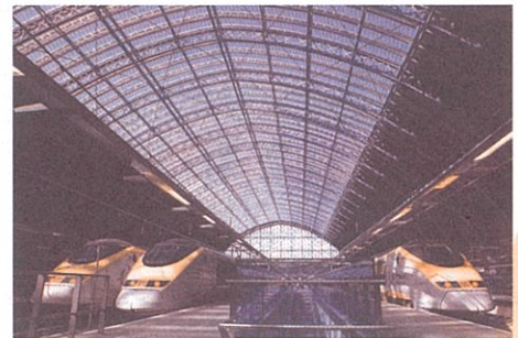
「ロンドン セント・パンクラス駅のユーロスター」