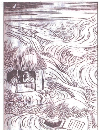
寛政4年の洪水 賀茂郡造賀村(現東広島市) 「芸備孝義伝(二編)」より(広島城蔵)