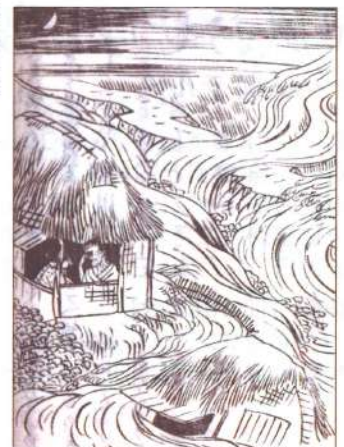
寛政4年の洪水 賀茂郡造賀村(現東広島市) 「芸備孝義伝(二編)」より(広島城蔵)