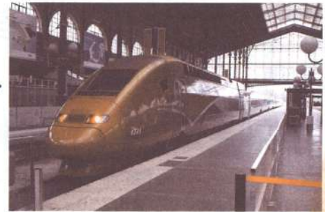
「タリス(PBKA型)」