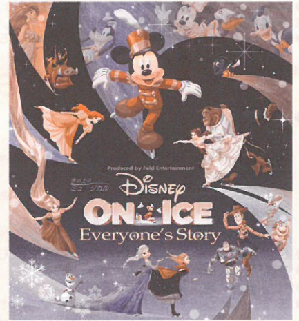
© Disney characters and artwork © Disney, Disney/Pixar characters © Disney/Pixar