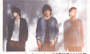
back number ※7月22日(土)出演