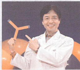
※当日の実験内容は写真とは異なる場合がございます。